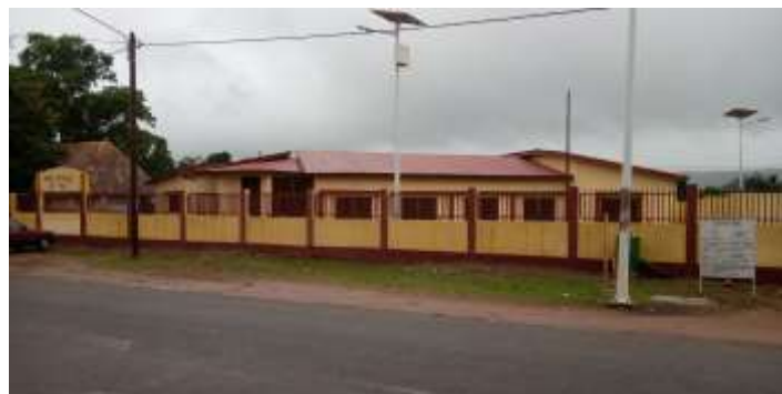
Siège de la Mairie de la Commune Urbaine de Pita