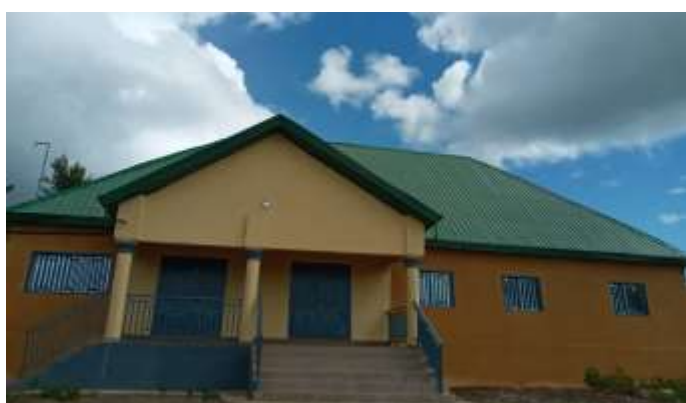
Siège de la Commune Rurale de Kankalabé