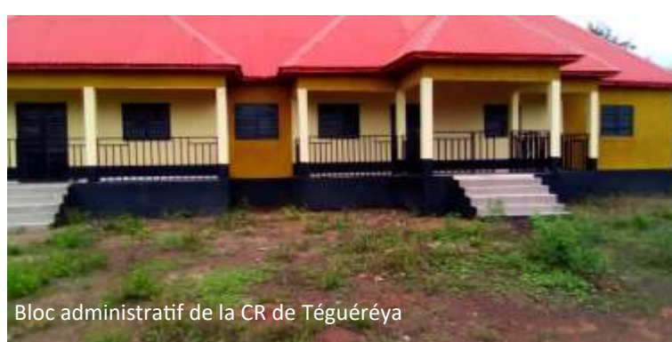
Bloc administratif de la CR de Téguéréya