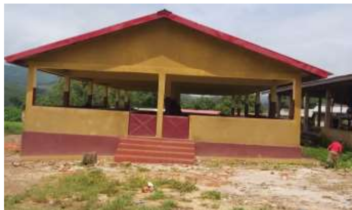
Hangar du marché de Koba centre