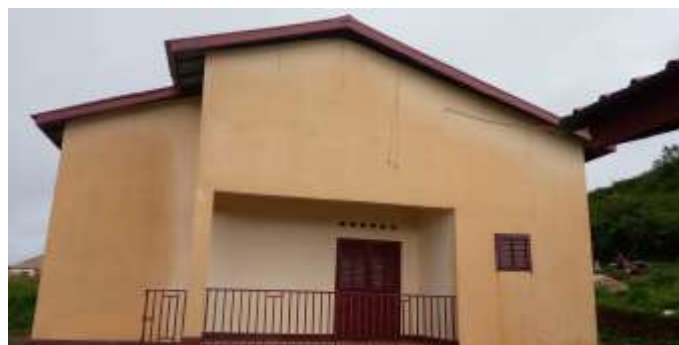
Foyer des jeunes de la CR de Maci