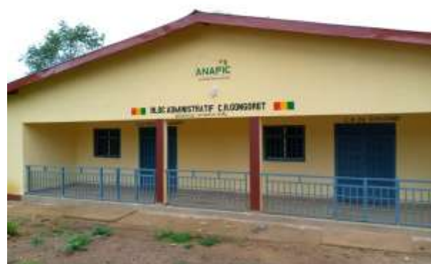
Bloc Administratif du District de Gongoret Centre dans la CR de Gongoret