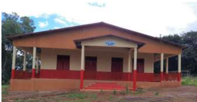
Maison des jeunes de la CR de Sintaly