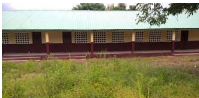
Ecole primaire de Dougaya, District de Dougaya, CR de Mombeya