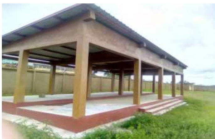
Tribune du terrain de football de Ditinn centre