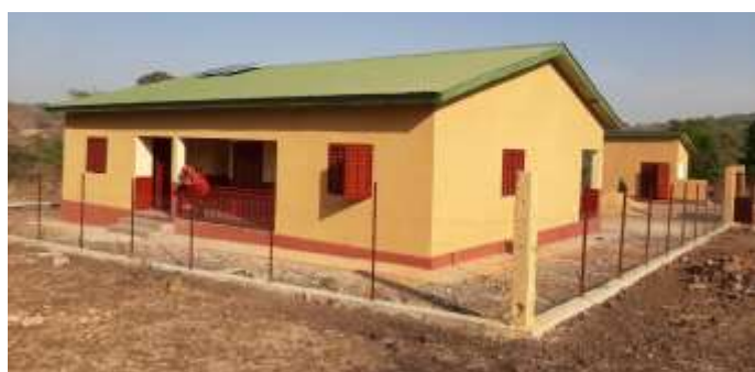
Poste de santé de Madina District Dondet, CR de Mafara