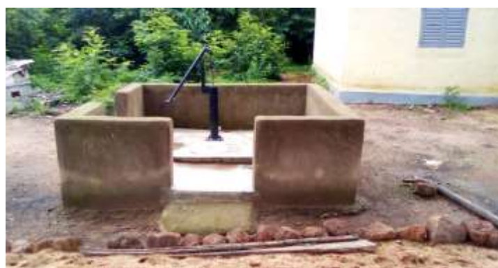
Puits amélioré dans le District de Finala, CR de Téguéréya.