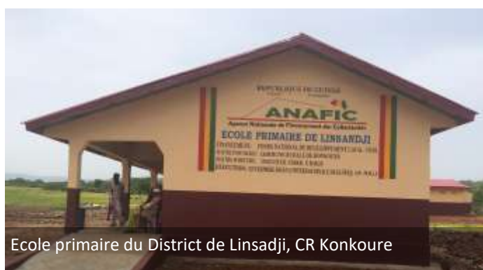
Ecole primaire du District de Linsadji, CR Konkoure