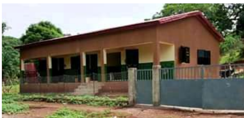
Poste de santé du District de Yomaya dans la CR de Ouré Kaba