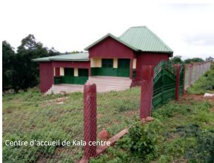
Centre d'accueil de Kala centre