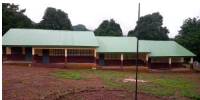
Ecole Primaire District Sandama, CR de Maci,