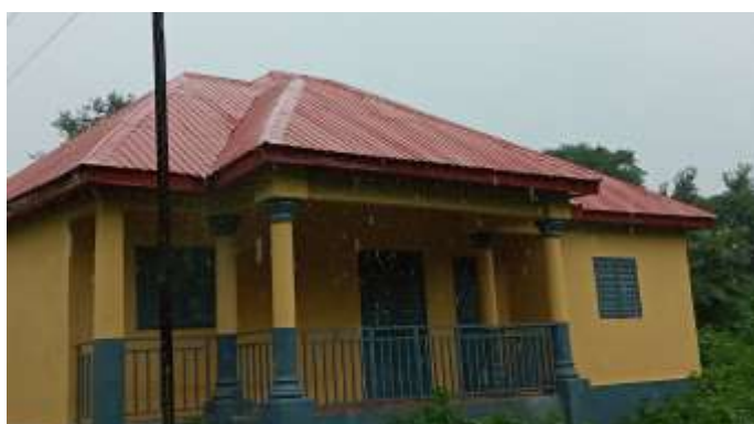
Centre d'accueil de la CR de Tolo