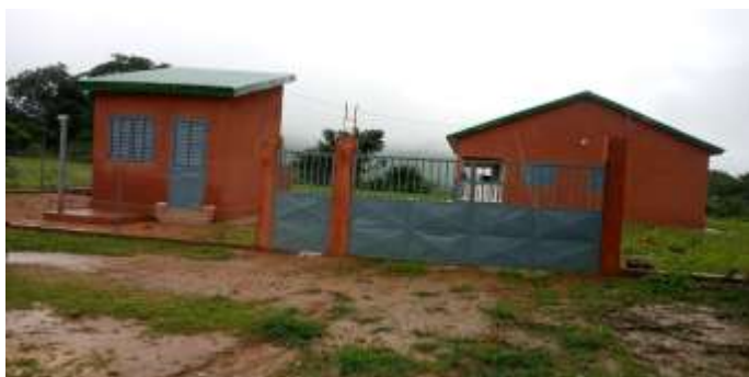
Poste de Santé du District Ley Tangande, CR Maci