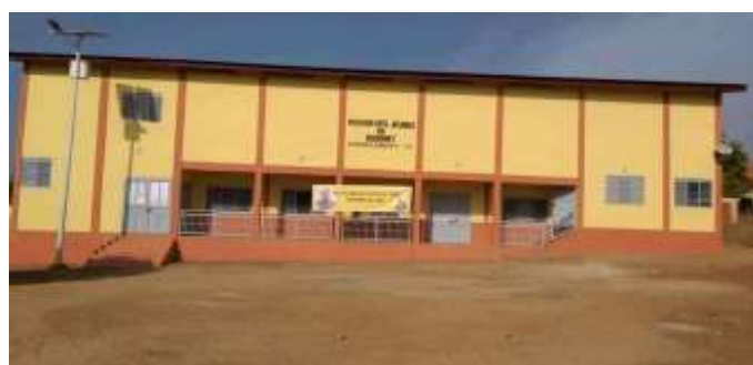
Maison des jeunes de la CR de Dogomet