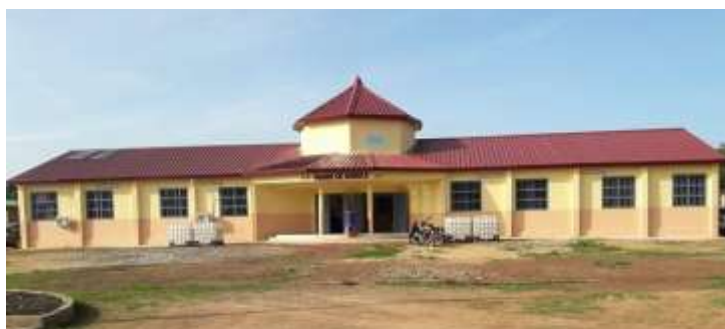
Siège de la Mairie de la Commune Urbaine de Dabola