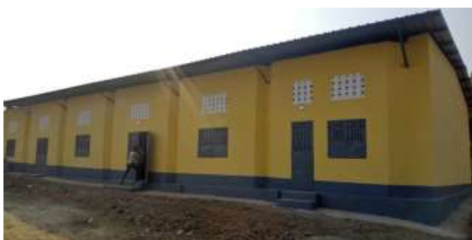
Maison des jeunes de Sandénia