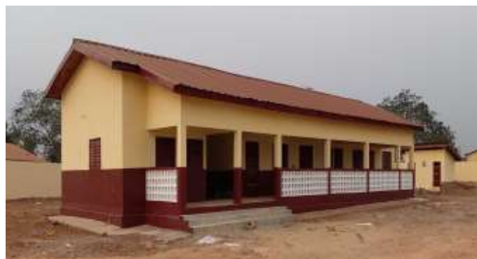
Centre dans Santé de CU de Faranah