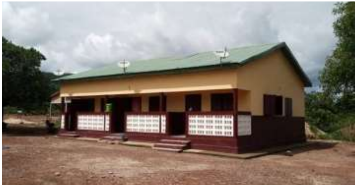
Ecole Primaire de la CR de Banora