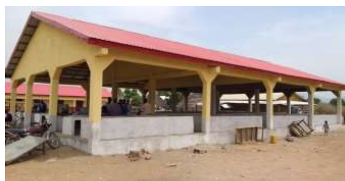
Hangar du marché de la Commune Rurale de Kankama