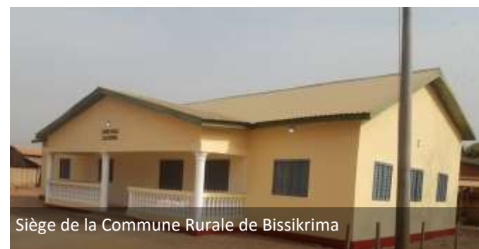
Siège de la Commune Rurale de Bissikrima