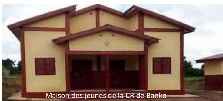
Maison des jeunes de la CR de Banko