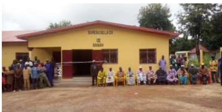
Bureau de la CR de Banian