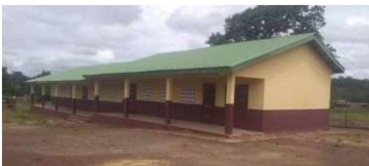
Ecole Primaire dans la CR de Heremakonon