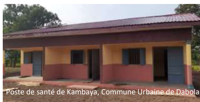
Poste de santé de Kambaya, Commune Urbaine de Dabola