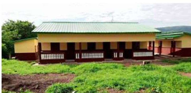
Logement des enseignants de la CR de Konindou