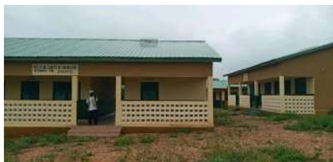
Poste de santé dans la CR de Marella