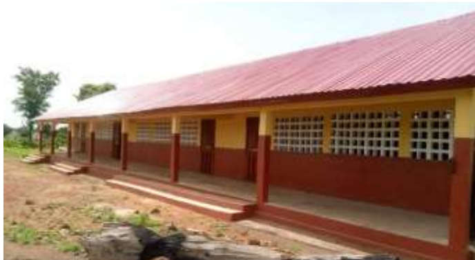
Ecole Primaire de la CR de Banora