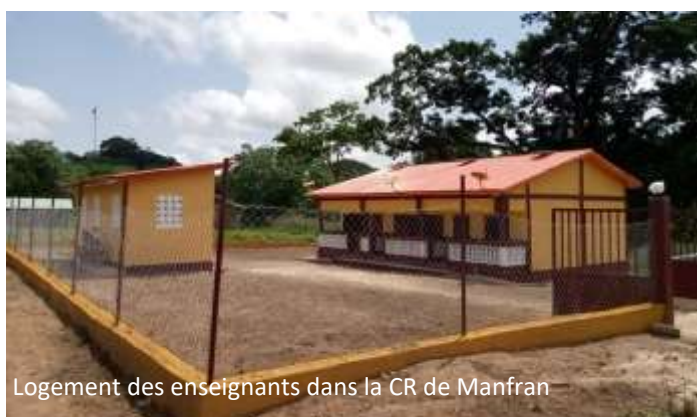
Logement des enseignants dans la CR de Manfran