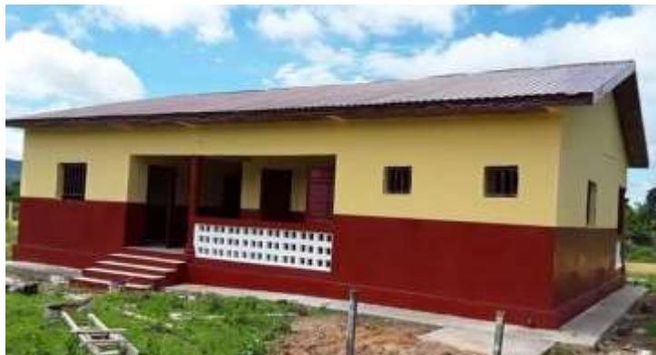
Poste de santé de la CR de Lansanaya