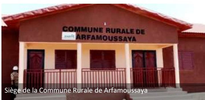
Siège de la Commune Rurale de Arfamoussaya