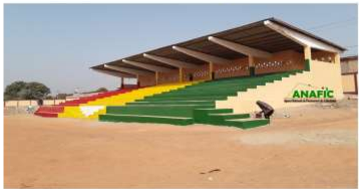
Tribune de la Commune Urbaine de Kissidougou