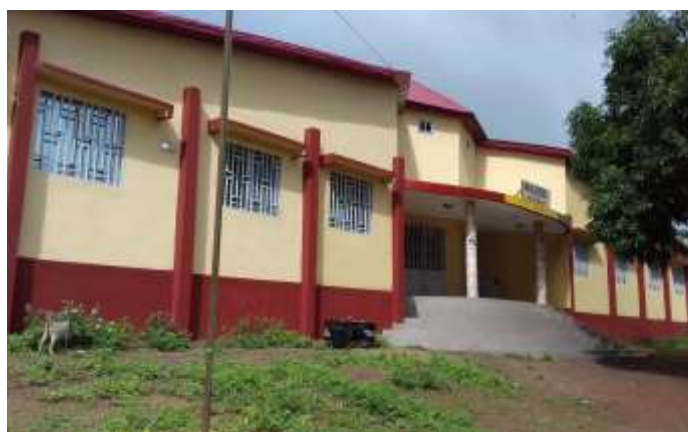
Siège de la commune urbaine de Dinguiraye