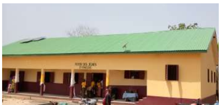
Foyer des jeunes de la CR de Fermessadou