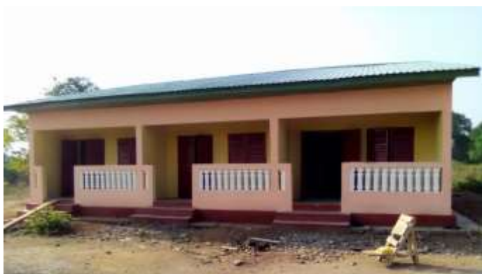
Poste de santé de la CR de Sélouma