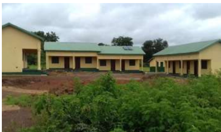
Centre d'accueil de la commune urbaine de Dinguiraye