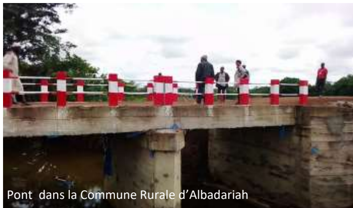
Pont dans la Commune Rurale d'Albadariah