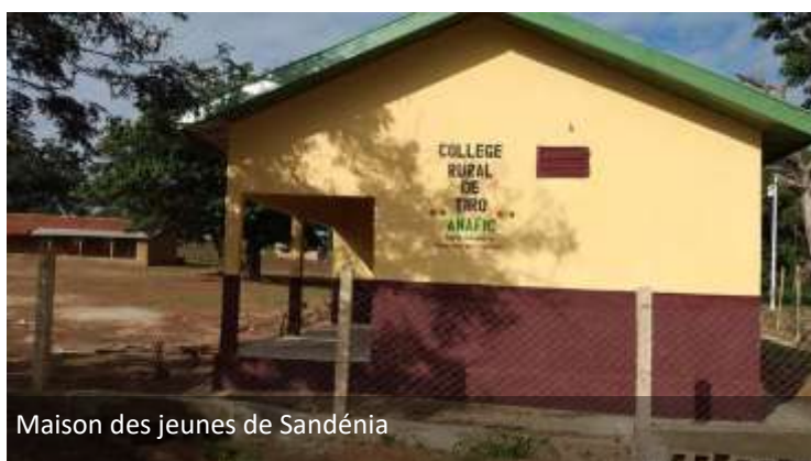
Maison des jeunes de Sandénia